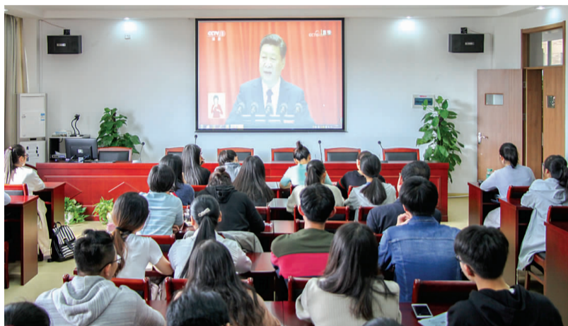
10月18日，中国共产党第十九次全国代表大会在北京隆重召开。我校师生通过网络组织收看十九大开幕式。图为经贸管理学院师生收看十九大开幕式盛况。