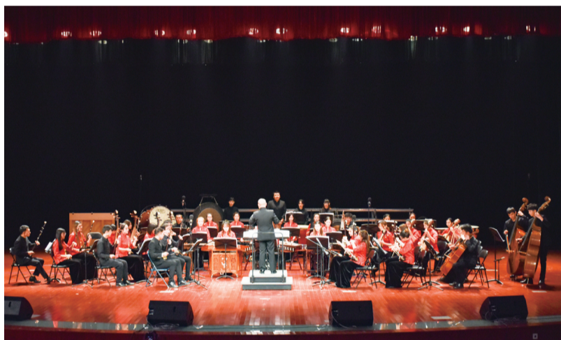
11月20日晚,浙江音乐学院实习乐团在我校椒江校区大礼堂举行高雅艺术进校园专场演出,现场气氛热烈,观众热情高涨。图为实习乐团演出场景。