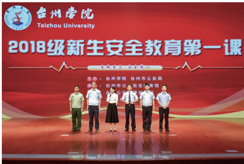
9月10日晚，2018级新生“安全健康教育”第一课活动在椒江校区大礼堂开展，该活动以“生命至上，安全第一”为主题，旨在让新生掌握必备的安全健康知识。图为台州公安青警讲师团讲师合影。