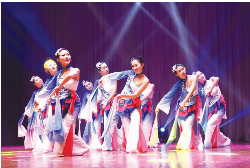
1月10日晚,教师教育学院于临海校区影剧院,举办15级学前专业舞蹈考核汇报演出。图为学前佳人在表演古典舞《凤酥雨忆》时的曼妙之姿。